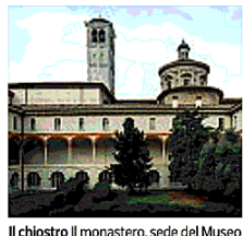
Il chiostro Il monastero, sede del Museo